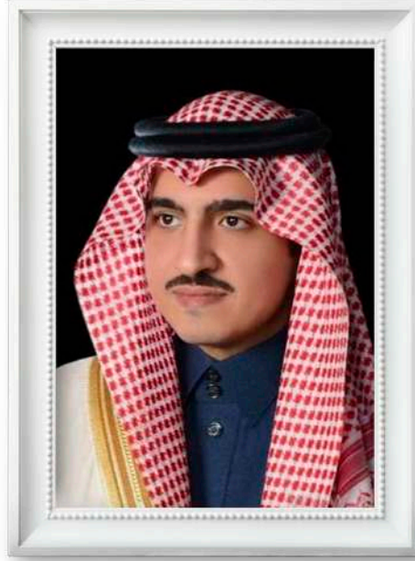
صاحب السمو الملكي الأمير بدر بن سلطان نائب أمير منطقة مكة المكرمة