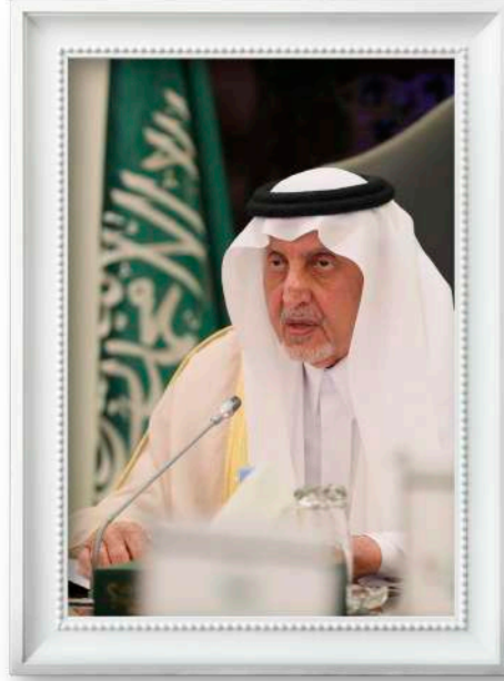
مستشار خادم الحرمين الشريفين صاحب السمو الملكي الأمير خالد الفيصل أمير منطقة مكة المكرمة